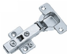
Bisagra de cazoleta Tipo: Clip Recta 3D Base Zamac Ajust., Ø: 35mm Modelo: 315