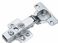
Bisagra de cazoleta Tipo: Clip Recta 3D Base Ajustable, Ø: 35mm Modelo: 316