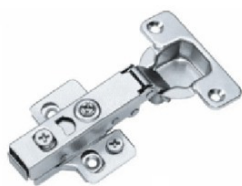
Bisagra de cazoleta con Freno Tipo: Clip Recta 3D Base Ajustable, Ø: 35mm Modelo: 313